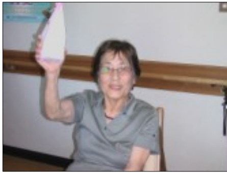
敬老会のプレゼントです